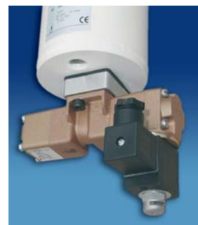
Option: Purge-Stop Ventil

Membrantrockner verwenden einen geringen Teil der Druckluft als Spülluft. Die Menge an Spülluft ist u.A. Abhängig von dem gewünschten Drucktaupunkt. Bei der Baureihe DMM ist der Membranbündel in einem druckfesten Gehäuse untergebracht. Diese Ausführung bietet die Möglichkeit, den Spülluftfluss zu unterbrechen und somit die Wirtschaftlichkeit erheblich zu steigern. Ein hier für optional montiertes Magnetventil kann vom Kompressor-Laufkontakt auf- und zugesteuert werden.